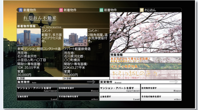
不動産バーチャル展示CMS