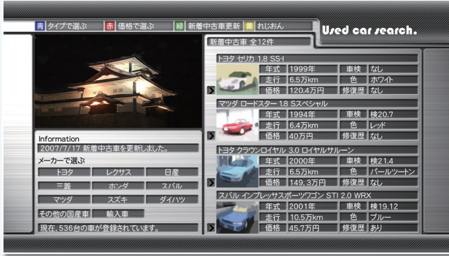
中古車バーチャル展示CMS